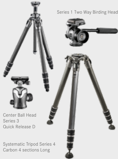
Center Ball Head Series 3 Quick Release D